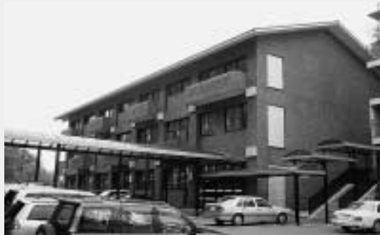
温習室（集団学習室）