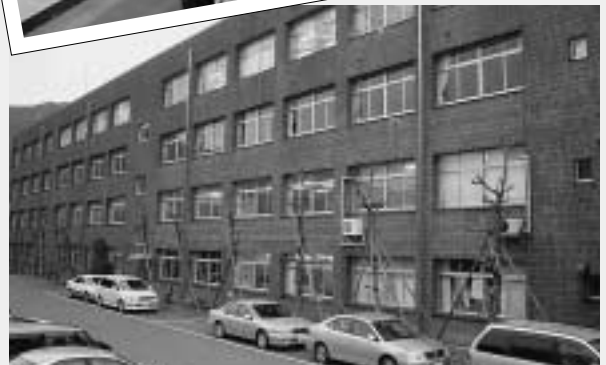
南側校舎を望山寮B棟側から